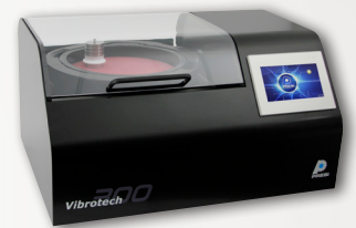
VIBROTECH Programmierbares Vibrationspoliergerät