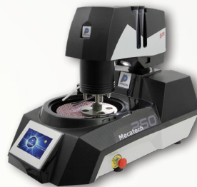
MECATECH Halbautomatisches Schleif- und Poliergerät